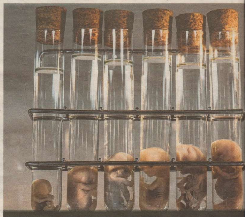
Foetussen in formol.

didactische meerwaarde voor een jonge assistent om zo'n levertumor eens in het echt te zien.'